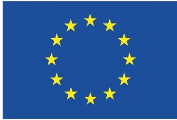
Euroopa Liit Euroopa Regionaalarengu Fond